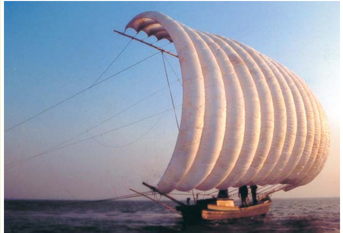
▲<写真提供> 藤井 和男 氏 美浦村老人クラブ連合会趣味クラブ 「写真クラブ」所属