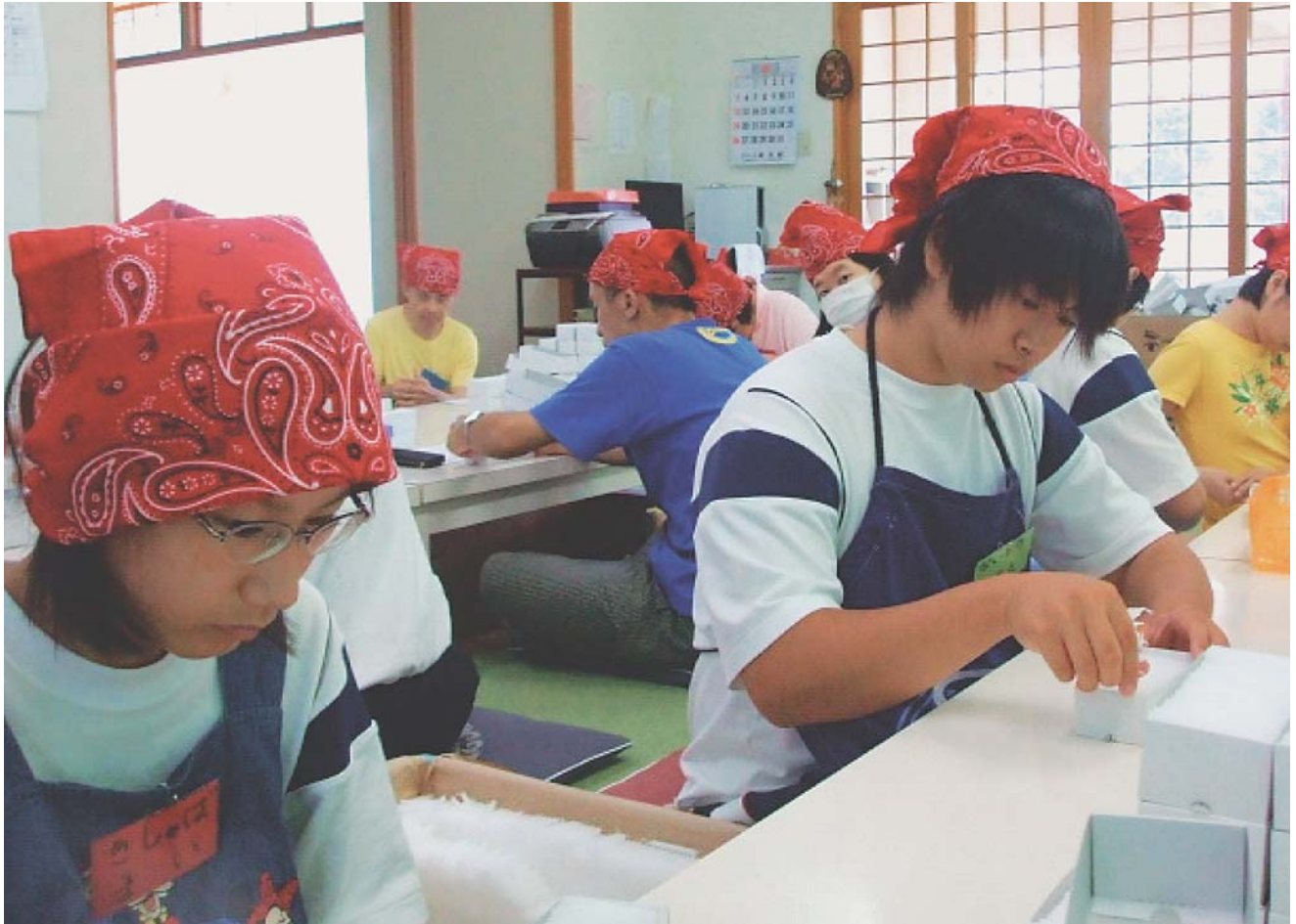
ボランティア体験月間／美浦中学生徒による職場体験学習