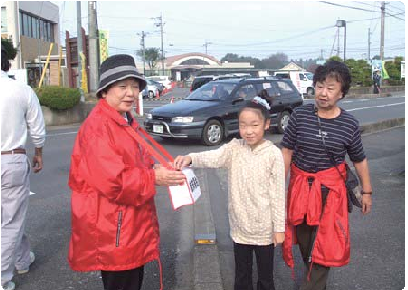
美駒ボランティアによる街頭募金の様子