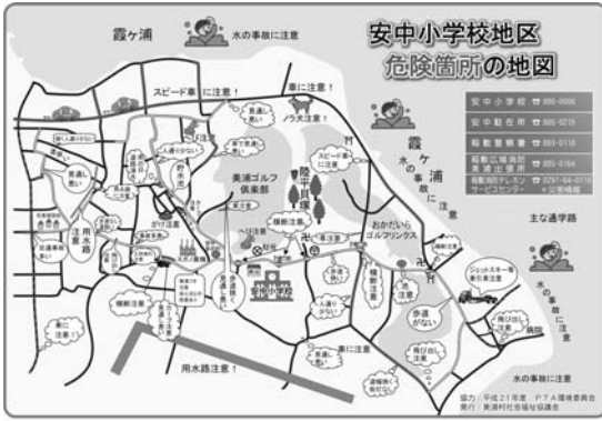
いつでも見られるように福祉マップを下敷きに

子どもたちが地域福祉の心を育くむことを目的として、安中小学校区をモデルとした福祉教育事業を学校や保護者・地域住民の協力を得ながら行い、防災訓練や福祉マップを作成しました。また、村内小中学生から募集した敬老福祉作文集を発行しました。