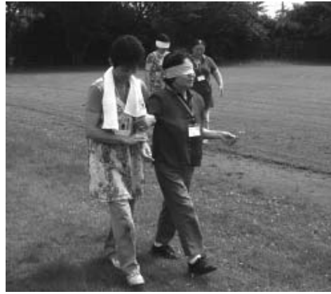
目が不自由な方の気持ちになって