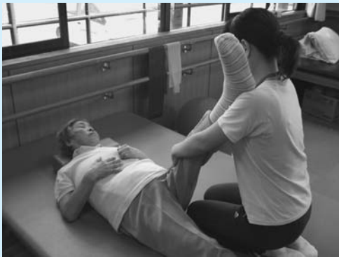
理学療法士による機能訓練を頑張って行っています！

通所介護事業所では、皆様によりよい生活を送っていただけるよう、従来の入浴介助、排泄介助といった身体介護サービスに加え、運動機能向上サービス、口腔機能向上サービスを取り入れています。利用者の介護予防に対する意識の高まりもあって、活気に満ちあふれる通所介護事業となっております。