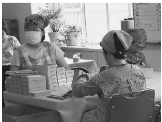
ホープ作業所でローソクの内職風景