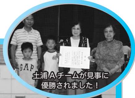
土浦Aチームが見事に優勝されました！