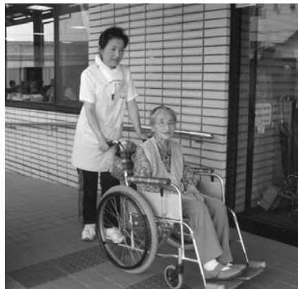
通所介護事業 朝の送迎の1コマ

美浦村デイサービスセンターを事業所として、送迎、入浴、食事、健康チェック、レクリエーション、日常動作訓練等のサービスを提供しています。