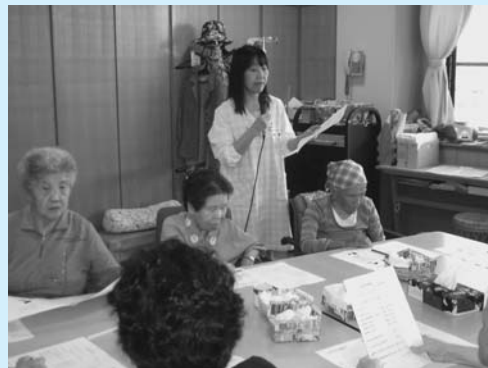
食べものが健康を維持します！管理栄養士による栄養教室