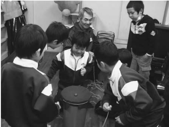
大谷児童館で老人クラブ会員とベーゴマ交流

親・子・孫が輪投げを通してお互いに交流することを目的とした「三世代ふれあい輪投げ大会」、メンコやお手玉などの昔の遊びを通じて高齢者と児童との交流を目的とした「昔ながらの遊び交流会」を実施しました。