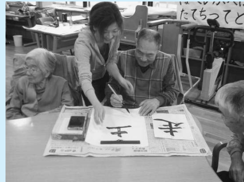
書道の先生のボランティアによるレクリエーション

理学療法士(リハビリの専門職)・歯科衛生士・栄養士・介護福祉士・看護師・社会福祉士等の多職種が関わっているからこそ提供できるサービスです。