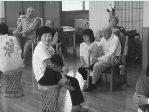
定期的に講師を招いて、シルバーリハビリ体操を行っています！