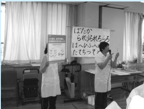
口の中の勉強をします！歯科衛生士による口腔教室