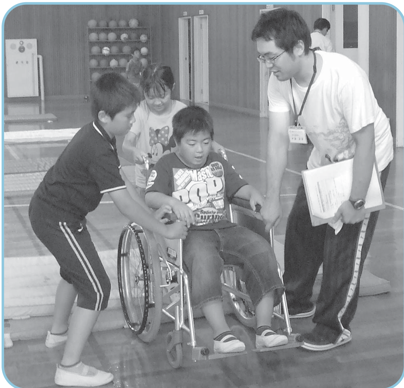
安中小学校で車いす体験学習を行いました！