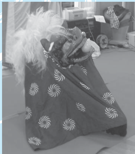
獅子舞で、ご利用者の無病息災祈願

通所介護事業所では、日頃鍛錬された芸を発表してくださる演芸ボランティアを募集しております。詳細はお問い合わせ下さい。(電話：885-8885 担当：伊藤)