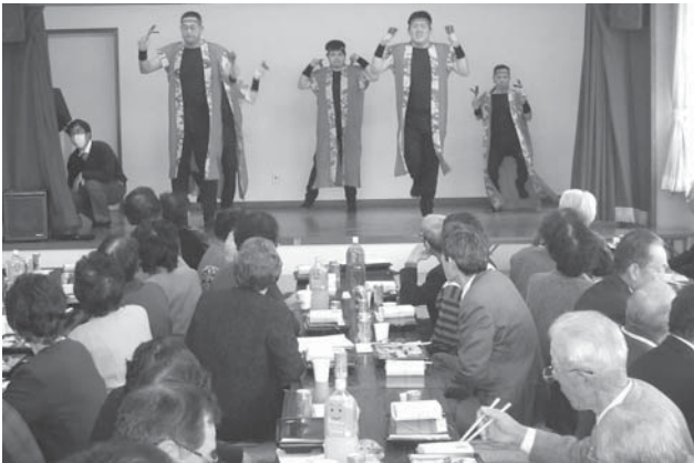
喜寿御祝会には68名のご出席をいただきました

当会のお知らせやご案内を掲載した当広報誌を年6回、村内の約5千世帯にお届けしました。