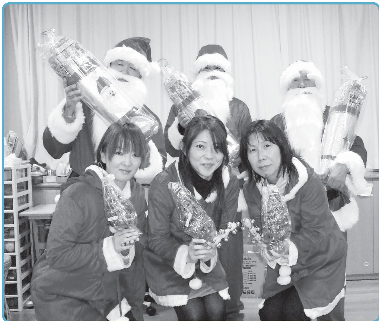
歳末たすけあい事業「サンタが美浦にやってくる」