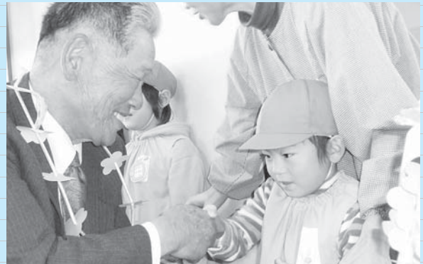
「木原保育所児から手作りの首飾りが贈られました」