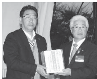
日本ゴルフツアー機構様より