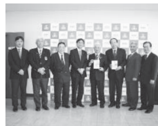
ジュニアゴルファー育成財団様及び株平和様より