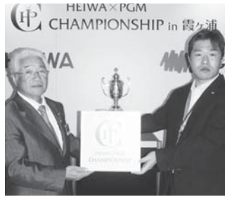
(一社) 日本ゴルフツアー機構様 / ジャパンゴルフツアー選手会様より