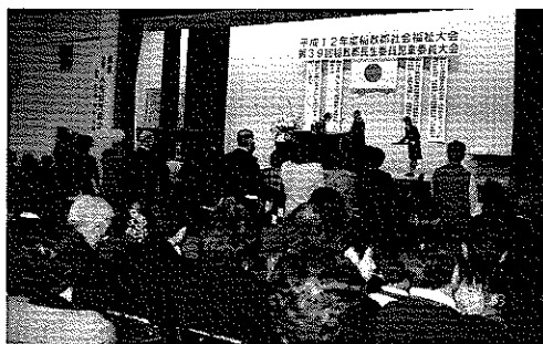
平成12年度 稲敷郡福祉大会 (東中学校体育館)