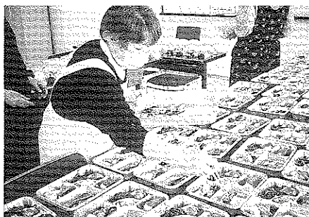
手づくりの味が、ご利用者にも好評です