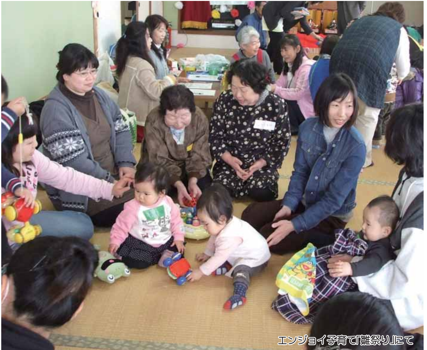
エンジョイ子育て「雑祭り」にて