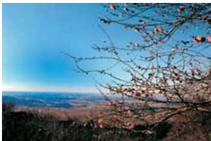
早春の梅林 写真提供 堀越健一郎氏 美浦村老人クラブ連合会趣味クラブ 「写真クラブ」所属