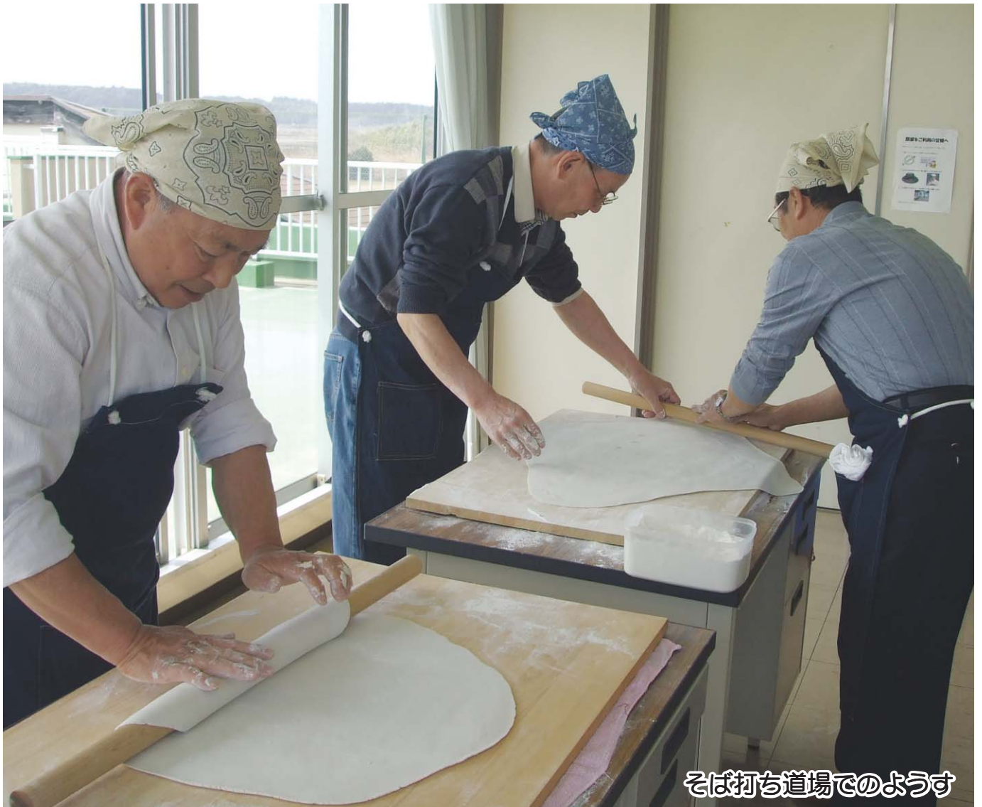
そば打ち道場でのようす