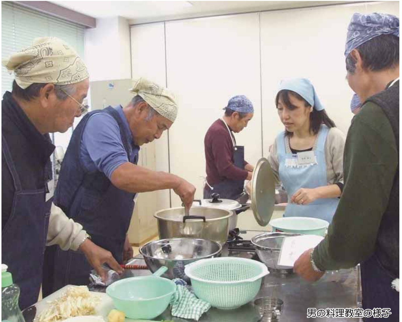
男の料理教室の様子