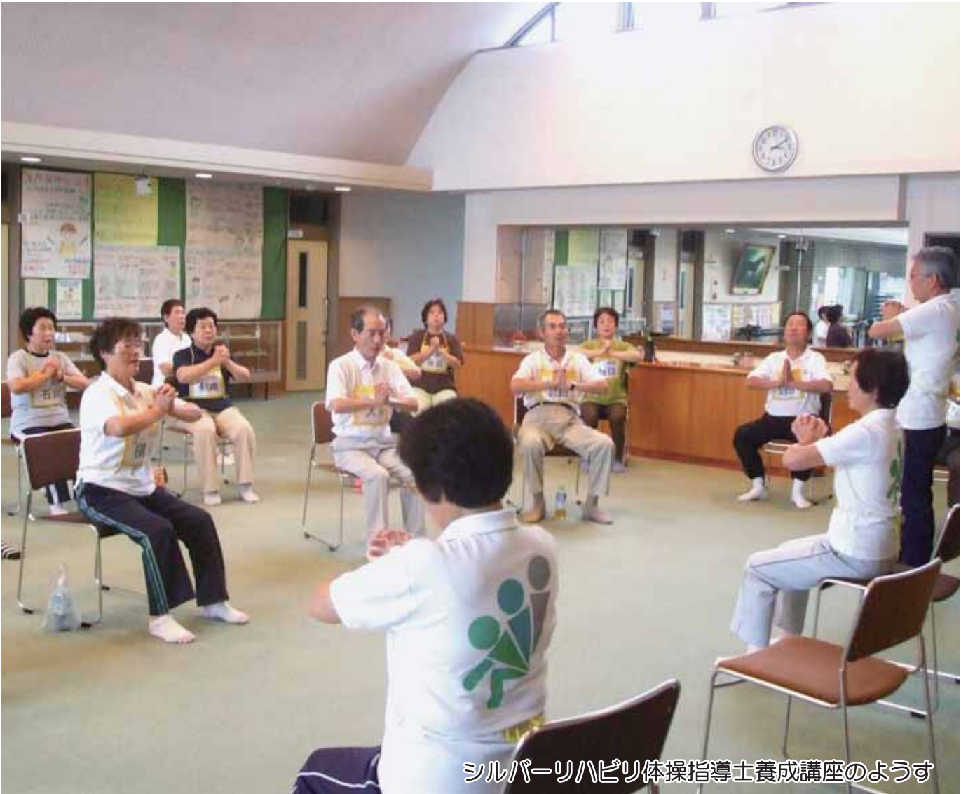
シルバーリハビリ体操指導士養成講座のようす