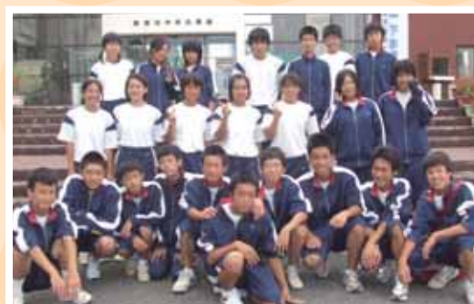
美浦中ボランティア委員会のみなさん