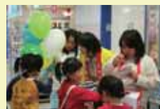
ジャスコ東海店にて