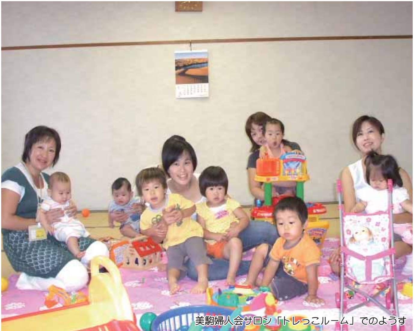
美駒婦人会サロン「トレッコルーム」でのようす