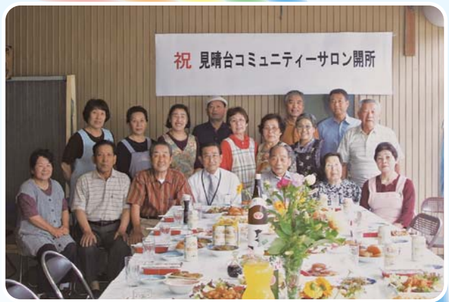
祝 見晴台コミュニティーサロン開所