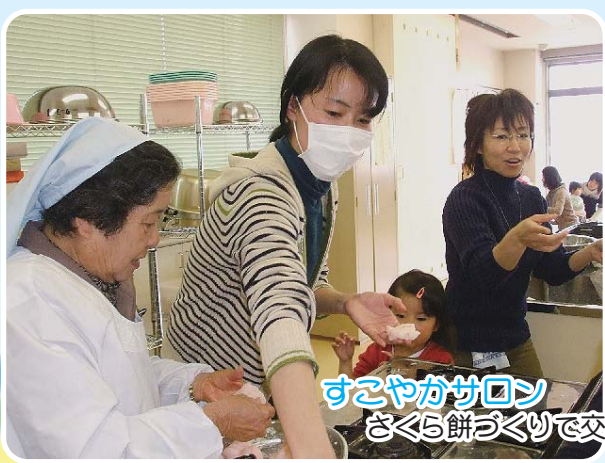
すこやかサロン さくら餅づくりで交流会