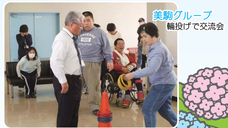
美駒グループ 輪投げで交流会