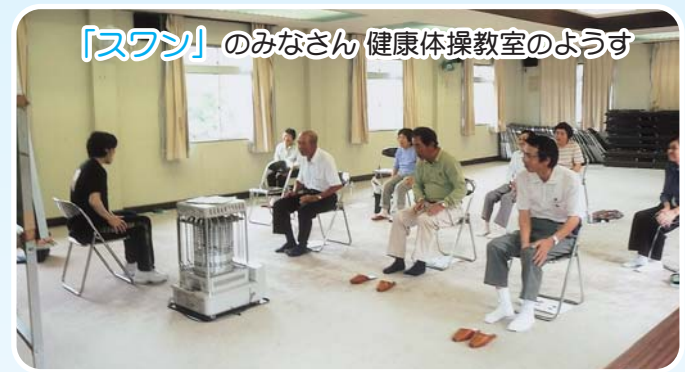
「スワン」のみなさん 健康体操教室のようす