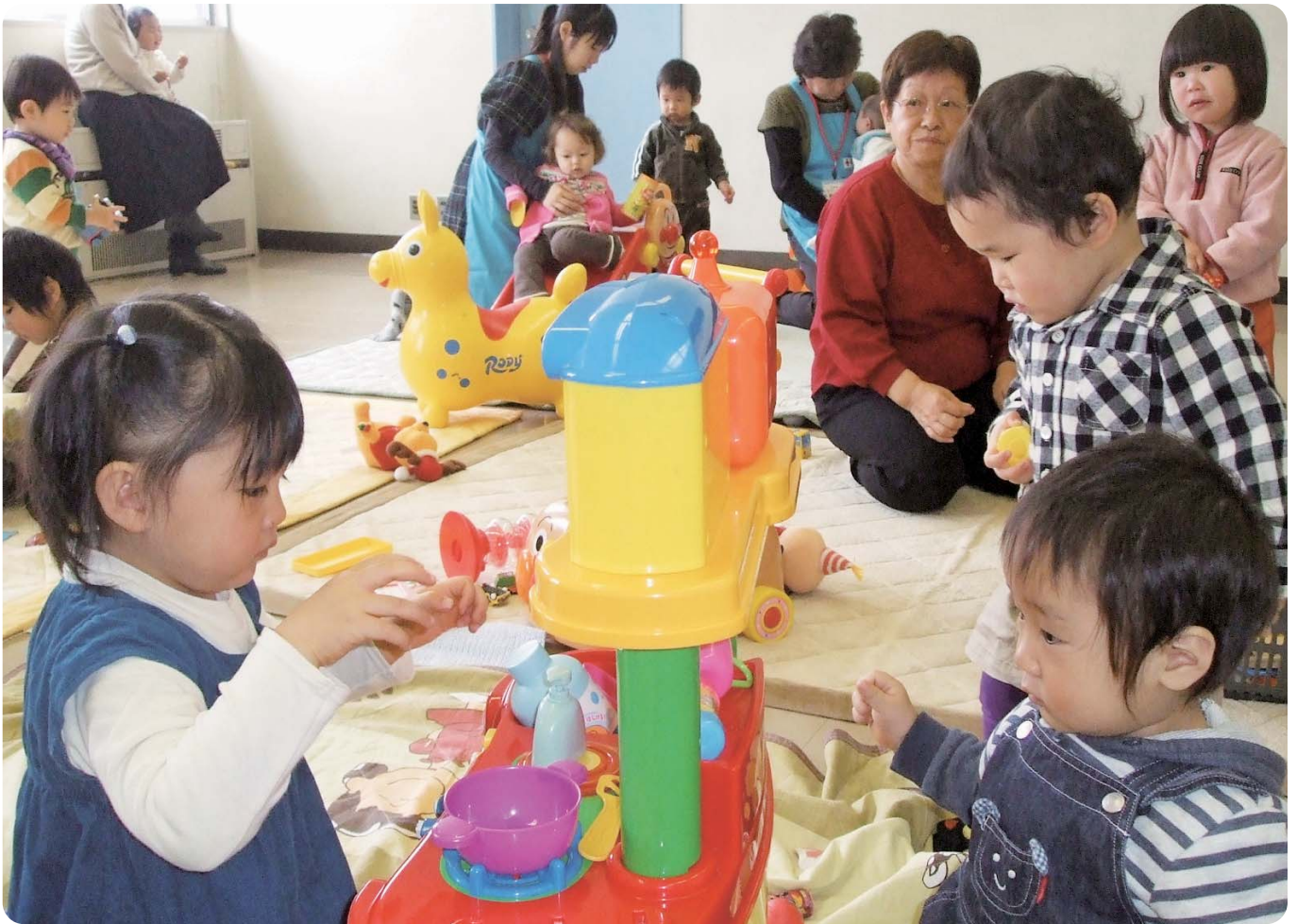
美駒婦人部「とれっ子ルーム」サロンの様子