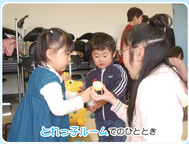
とれっ子ルームでのひととき