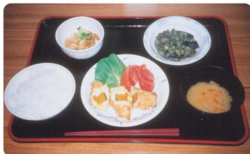
(献立: ささみの南瓜はさみ揚げ、なすと枝豆のごま味噌和え、和風ポテトサラダ、味噌汁)