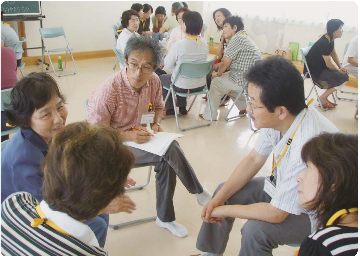
傾聴ボランティア養成講座受講中の様子(講師/中央)