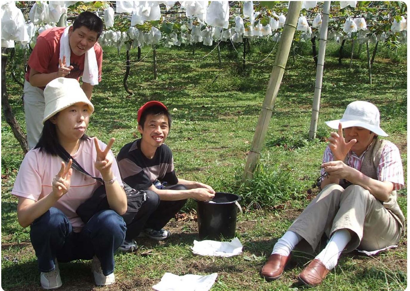
地域活動支援センター「ホープ」ぶどう狩り