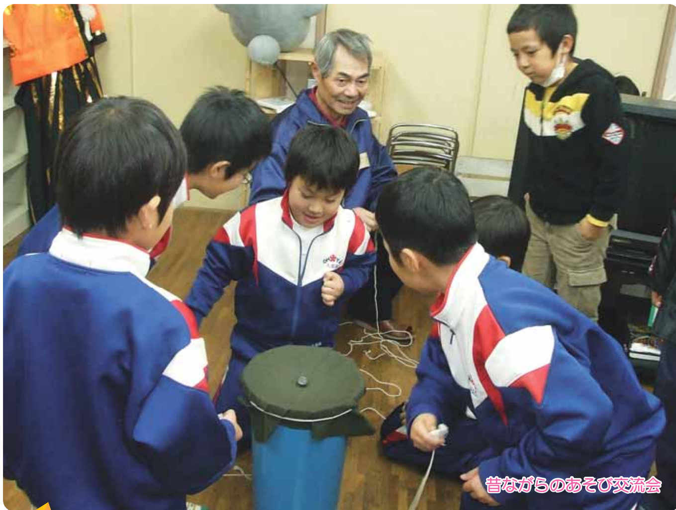
昔ながらのあそび交流会