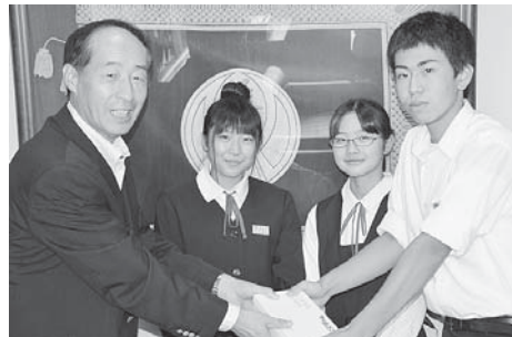
美浦村立美浦中学校生徒会から

※古切手を収集の場合、切手のまわりの余白を5ミリ～1センチ位残して切り取り、日本切手と外国切手に分けてください。