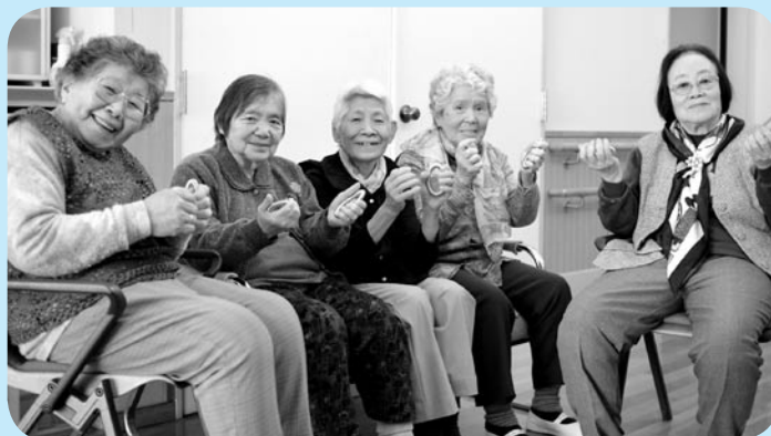
どこでも簡単！手軽にエクササイズ！