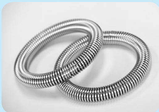
高橋スプリング製作所 特製ハンドグリップ！

皆さんはご存じでしょうか？ある調査研究で、握力の低下が認知症になるリスクを高めるのではないかと調査結果が発表されました。理由はまだ解明されていませんが、手指には沢山の神経が集まっているので、手先をよりしっかりと動かしている方は握力を維持し続け、神経も活発になり、認知症予防に繋がっているのかもしれない。当通所介護事業所では、木原の高橋スプリング製作所さんからいただいた、スプリング製のハンドグリップを使用し、握力の維持・向上を図っております。「手軽にできて、健康増進!!」とご利用者に好評です。