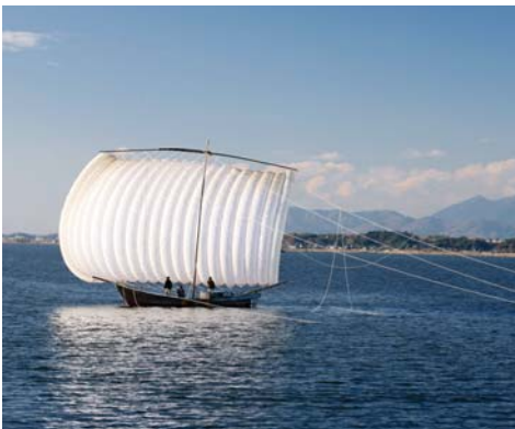
平成百景に選ばれるほどの美しい景観 ※茨城県ホームページより

41村が、霞ヶ浦四十八津と呼ばれる自治組織を結成し(美浦でも湖畔の村々は加入していました)、霞ヶ浦を入会(共同)管理していました。漁業資源の保護を図り、湖の秩序を維持するため、従来の漁業の慣習を明文化した「霞ヶ浦四拾八津掟書」を作成し、漁をするときの漁具、漁法、漁期の制限について規定しました。 有名な帆引き船は、明治時代に霞ヶ浦の漁師によって考案された船です。帆と網を結び、風力で網を引き、少人数での操業で大量の漁獲が得られたため、ワカサギ・シラウオ漁に用いられて広く普及しました。霞ヶ浦にたくさんの帆引き船が浮かぶ美しい景観は、エンジン船の普及により失われ、現在は観光用の運行のみとなっています。