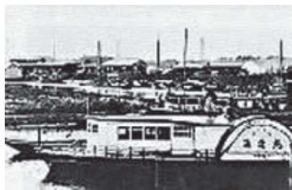
明治時代、蒸気船は文明開化の象徴

うです。あんパンが1個1銭の時代、木原から乗船すると運賃は片道で土浦(現土浦市)まで9銭、佐原まで26銭でした。