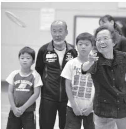
三世代輪投げ大会

親・子・孫が輪投げを通してお互いに交流することを目的とした「三世代ふれあい輪投げ大会」、保育所児と老人クラブ会員がレクリエーションをとおし、世代間のふれあいを深める「保育所児と高齢者のふれあい交流会」(荒天のため中止)、親子の絆を深める「いきいき親子社会体験バスツアー」を実施しました。