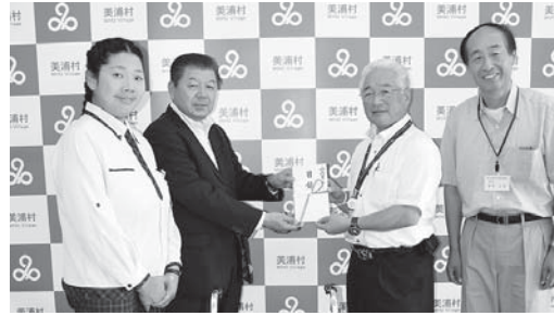
千葉県ヤクルト販売株式会社様より

美浦村社会福祉協議会では、寄付金の他、古切手や使用済み テレホンカード、書き損じ葉書を受け付けています。 ※古切手を収集の場合、切手のまわりの余白を5ミリ~1センチ 位残して切り取り、日本切手と外国切手に分けてください。