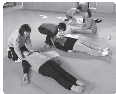
昨年の様子(自力整体)