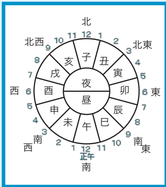
まんぼうしのおしゃべりタイム♪ ホームページより

左の図のように、方角と時刻を12分割して干支は使われています。お昼の12時を正午というのは「午（うま）」の時間帯の真ん中を指す言葉で、その前後の時間帯を「午前」「午後」と分けています。草木も眠る丑三つ時というのは、丑の時間帯（午前1時～3時）を四分割して3つめの時間帯である午前2時～2時30分の事を指しています。