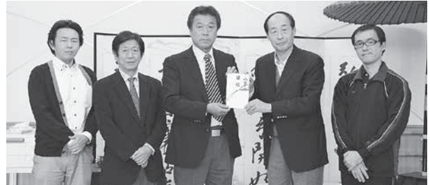
美浦ライオンズクラブ様より、デイサービスセンターへソファとテーブルをご寄付いただきました。