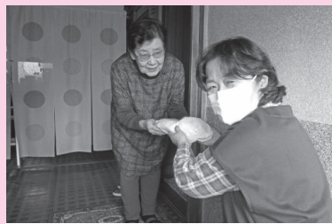
民生委員さんがお弁当をお届け

ひとり暮らし高齢者の安否確認と健康増進を目的に、民生委員やボランティア団体等のご協力を得て、月2回夕食の弁当等を配達しました。