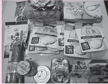
お渡しした食料品（一部）

生活にお困りの方を対象に、村内外の皆様（個人・店舗等）からの寄付食品を提供しました。茨城県社会福祉協議会や茨城県共同募金会からの助成金を活用して食材の購入も行いました。