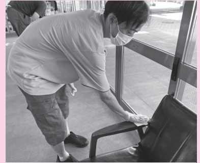
施設外就労（消毒作業）

一般就労が難しい方の就労機会の確保や能力の向上のため、施設での内職や生活訓練、施設外就労を実施しました。