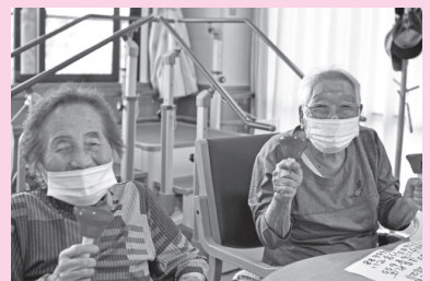
今日のレクはハンドベル