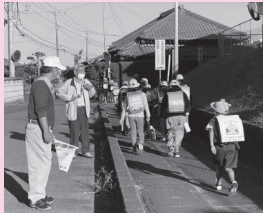
下校児童の見守り（木原地区）

地域の安心・安全の確保を目的に、村老人クラブ連合会と連携した「みほ見守り隊」が、下校児童・ひとり暮らし高齢者の見守り活動を行いました。