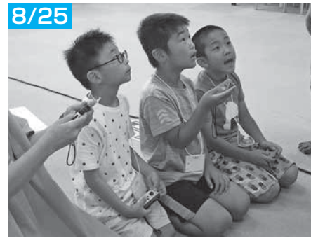
「ぷよぷよeスポーツ」で大連鎖！