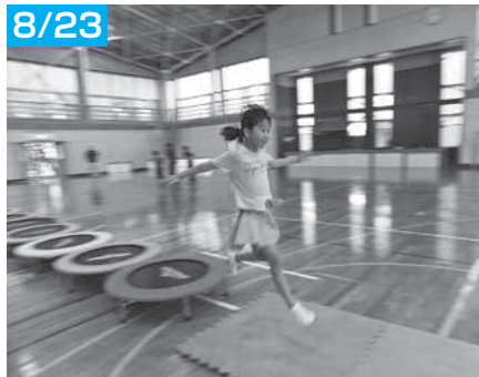
見事なトランポリン連続跳び！