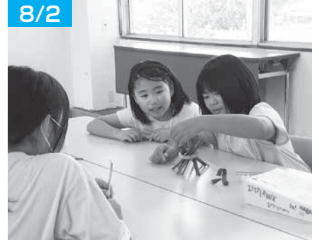
グラグラ棒、倒したら負けだよ