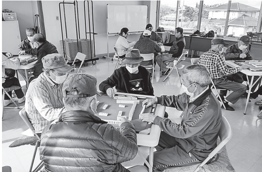
地域サロンの一例（健康麻雀）