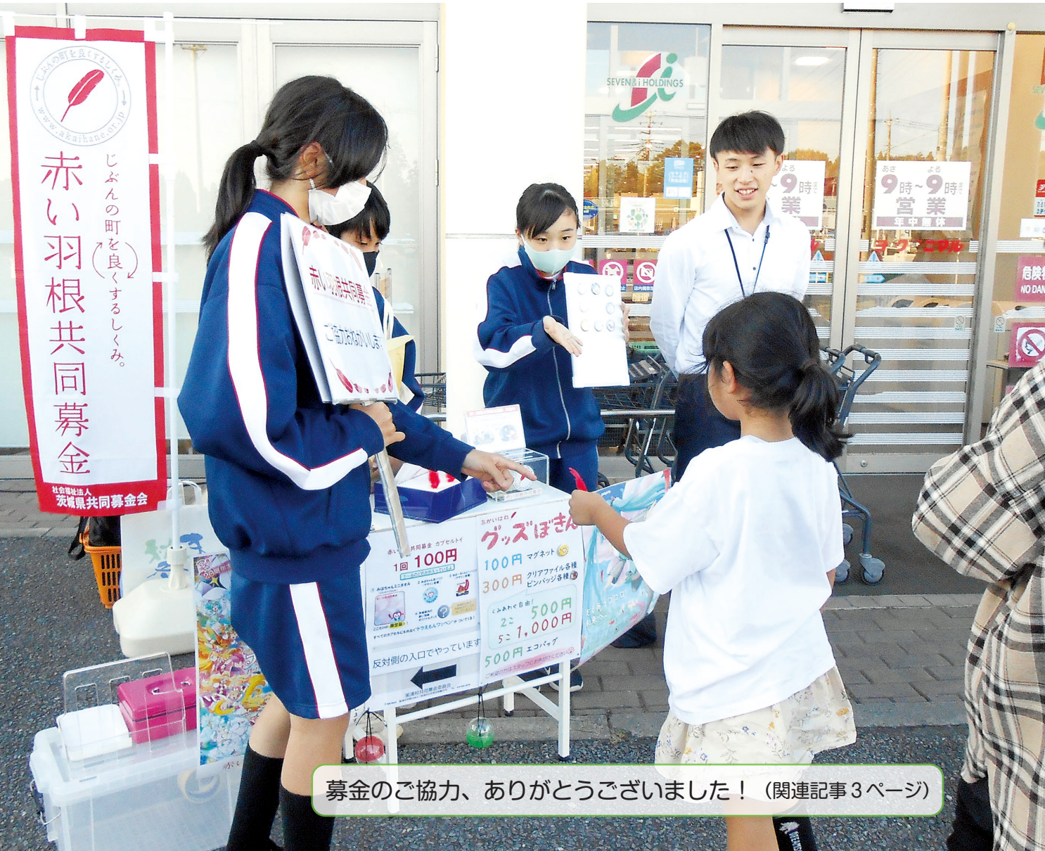
募金のご協力、ありがとうございました！（関連記事3ページ）