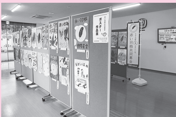
みほふれ愛プラザに、村内小学生が描いた作品68点を展示しました